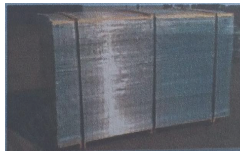
Single pallet 200 x100x 120 cm